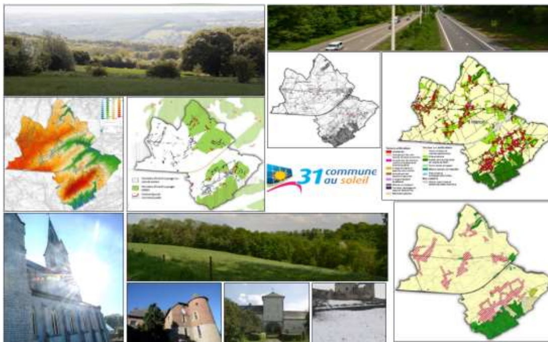
Carte postale du pilier environnement, 2016