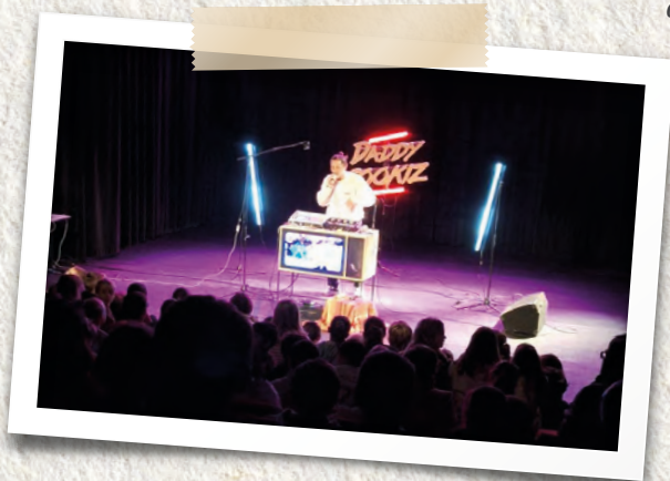
Les 3 es et 4 es primaires ont assisté au spectacle Boom Box Club au Centre culturel de Wanze