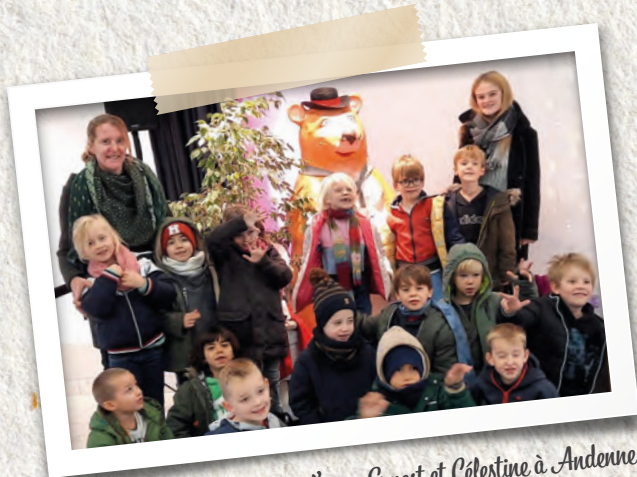
Visite par les 1 re primaire de l'expo Ernest et Célestine à Andenne