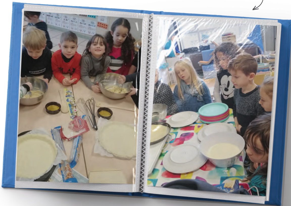
Atelier cuisine « Galette des Rois » : qui a eu la fève ?