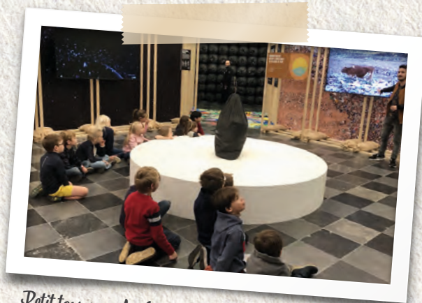
Petit tour pour les 1 re et 2 es primaires par l'expo «ordures» au Musée de la Vie wallonne à Liège