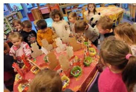
Vive les cloches !