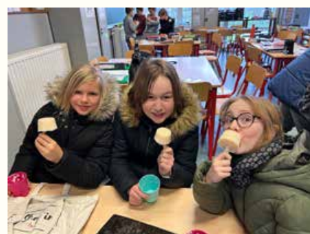
Rien ne se perd... Création de glaces à partir des restes de yaourt en 4-5-6 e années