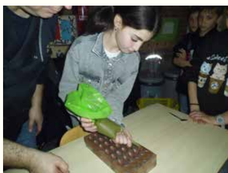
Atelier chocolat avec Emotions Chocolats en 4 e année