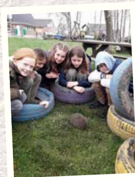
Les élèves de 4 e année rencontrent un hérisson