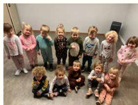
Journée pyjama en soutien aux enfants hospitalisés