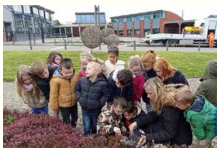
Projet sur les coccinelles en 1 re année