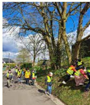
Action BEWAPP - Nettoyage du quartier pour les primaires