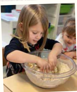
Préparation et dégustation de pizzas dans le cadre du projet Italie pour les 2 e maternelle