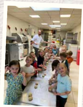
Visite à la boulangerie pour les 2 e maternelle