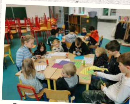
Parrainage des élèves de 6 e avec les 1 re maternelle pour construire une gondole