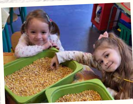
Ateliers sensoriels en maternelle