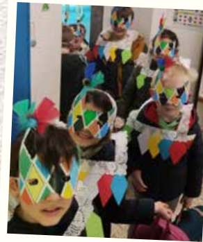
Projet Italie, découverte d'Arlequin pour les 3 e maternelle