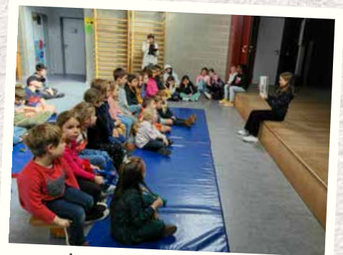
Les élèves de 5 e racontent des histoires aux élèves de maternelle