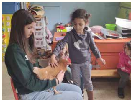
Visite de Madeleine et Mistigri, la poule et le coq en 3 e maternelle