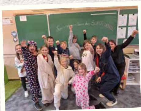
Journée pyjama en soutien aux enfants malades en 3 e année